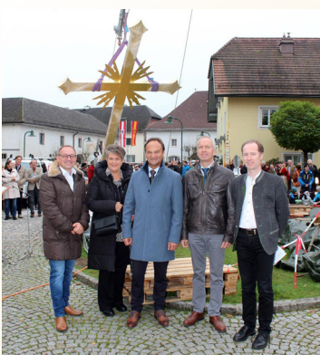
Bei der Turmkreuzsteckung

Im April dieses Jahres starteten wir als zweite Phase die Sanierung der Turmfassade, die im Juni abgeschlossen wurde.