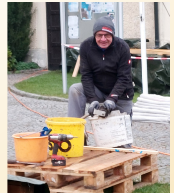
Fleißige Helfer unserer Pfarre leisteten einen wesentlichen Beitrag zum Gelingen

Es wurde zusätzlich die südseitige Fassade des Kirchenlanghauses renoviert – hier waren die Putzschäden am stärksten sichtbar.